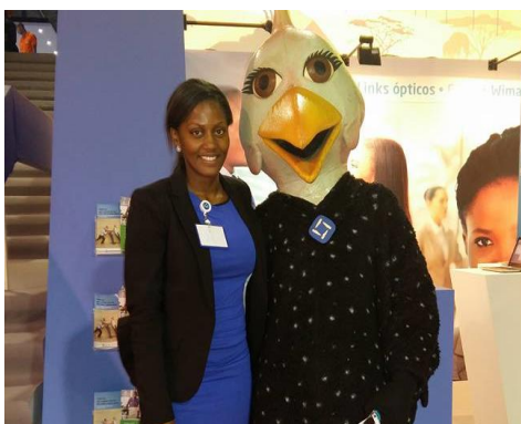
Foto tirada na 32ª edição da Filda com a mascote do nosso cliente BPC.

A nossa Missão mantém-se mais forte do que nunca e o lema é “servir para ser servido” , queremos ter clientes satisfeitos e tê-los sempre connosco.