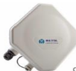
CPE BreezeMAX Pro 6000

Os equipamentos nomeados contemplam o novo pacote para PME's, a Net Pro e Net ProLight