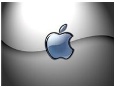
Simbolo da apple

A razão na qual levou os senhores acionar a