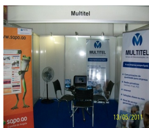
O stander da Multitel na Feira Internacional de Benguela

Quero aproveitar a oportunidade de informar, que a Multitel estará na Feira Internacional de Luanda, designada como FILDA.